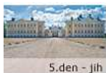
5.den - jih

Ještě plni včerejšího výletu na východ Lotyšska a vzpomínek na vynikající večeri naskakujeme do auta. Vlad je vysmátý, jako prakticky pořád, sluníčko zas pro změnu svítí a nás čeká cesta na jih krajiny. No jih to vlastně ani nebude, protože tam, kde končí jih, začíná sever a my pojedeme nejdříve